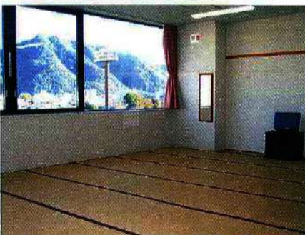
▲和室(7人/11人部屋)32室264名様まで

洋室シングルから和室の11人部屋までビジネスからファミリーまで、幅広く利用いただけます。